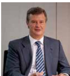
ALFONSO OSORIO ITURMENDI Presidente

Me complace presentarles nuestro Informe Anual de Transparencia correspondiente al ejercicio 2017.