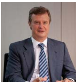
ALFONSO OSORIO ITURMENDI Presidente

Me complace presentarles nuestro Informe Anual de Transparencia correspondiente al ejercicio 2017.